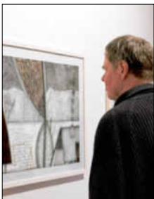
Christoph Meckel betrachtet eines seiner Werke...